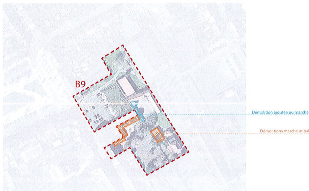
Figure 2 - Périmètre des démolitions du marché 25/022

En conséquence, il est proposé au Conseil Municipal d'inclure cette déconstruction complémentaire dans la programmation des démolitions initialement prévue au marché 25/022.