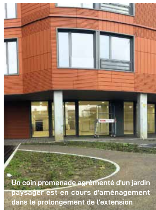
Un coin promenade agrémenté d'un jardin paysager est en cours d'aménagement dans le prolongement de l'extension