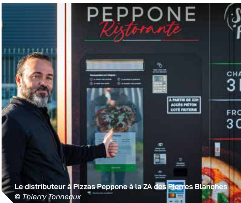
Le distributeur à Pizzas Peppone à la ZA des Pierres Blanches

Kiosque automatique à pizzas , rue Louis Petit, ZA des Pierres-Blanches (derrière Midas). Accès tous les jours, 24h/24. Téléchargez l'application gratuite « Smart Pizza » sur votre smartphone.