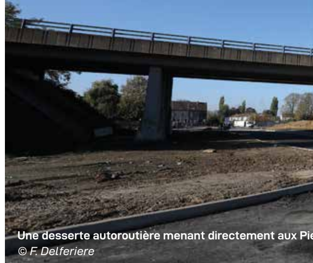
Une desserte autoroutière menant directement aux Pierres Blanches