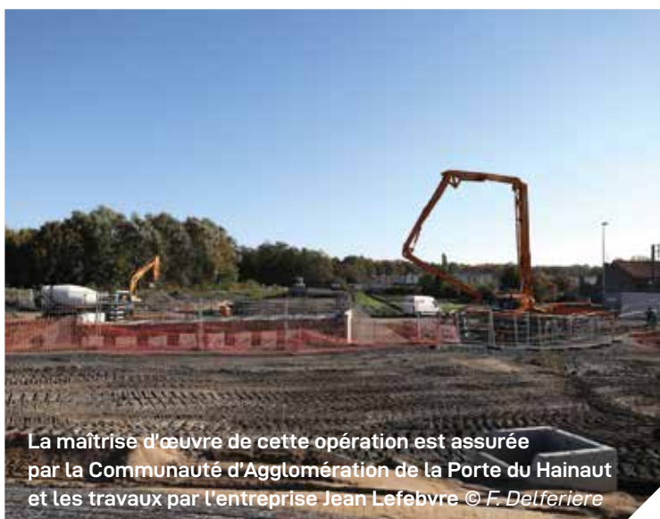
La maîtrise d'œuvre de cette opération est assurée par la Communauté d'Agglomération de la Porte du Hainaut et les travaux par l'entreprise Jean Lefebvre