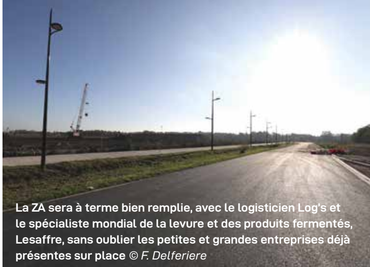
La ZA sera à terme bien remplie, avec le logisticien Log's et le spécialiste mondial de la levure et des produits fermentés, Lesaffre, sans oublier les petites et grandes entreprises déjà présentes sur place