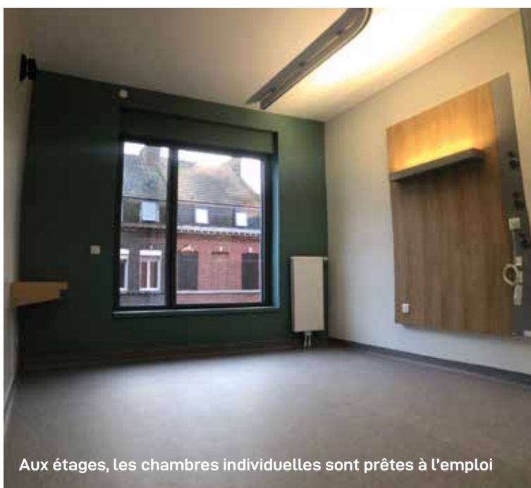
Aux étages, les chambres individuelles sont prêtes à l'emploi

La réhabilitation des deux ailes du bâtiment existant (V120) va pouvoir débuter. Immersion photographique au cœur d'un projet structurant pour l'établissement de santé et pour la Ville.