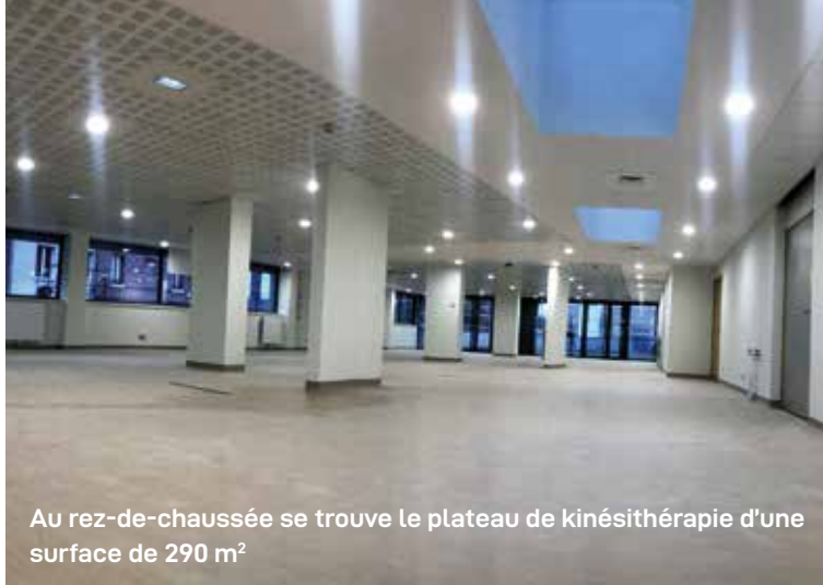
Au rez-de-chaussée se trouve le plateau de kinésithérapie d'une surface de 290 m 2