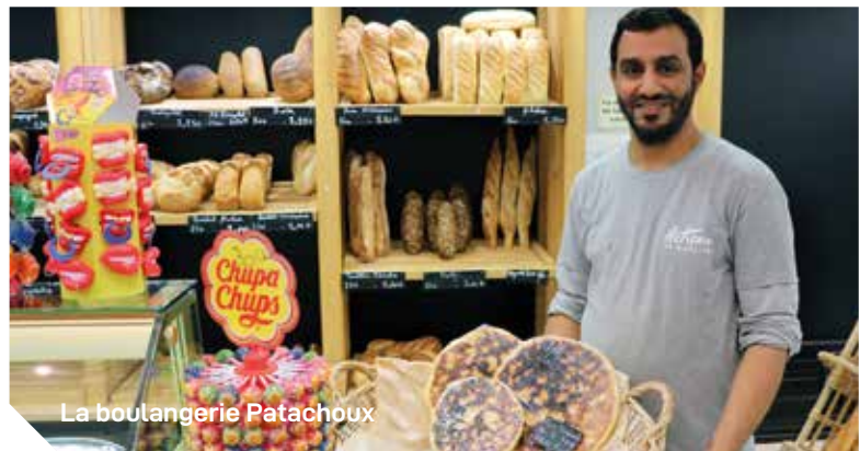
La boulangerie Patachoux

Le manège à photos : 1 place Wilson. Contact 06 58 16 89 83. Mail : lemanegeaphotos@gmail.com