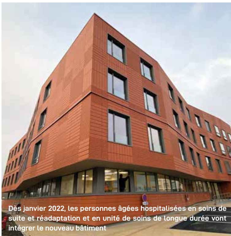
Dès janvier 2022, les personnes âgées hospitalisées en soins de suite et réadaptation et en unité de soins de longue durée vont intégrer le nouveau bâtiment