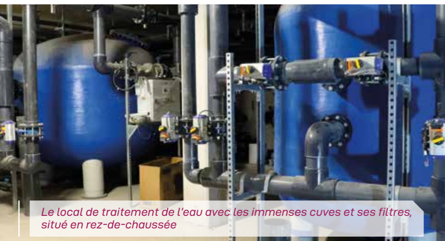
Le local de traitement de l'eau avec les immenses cuves et ses filtres, situé en rez-de-chaussée