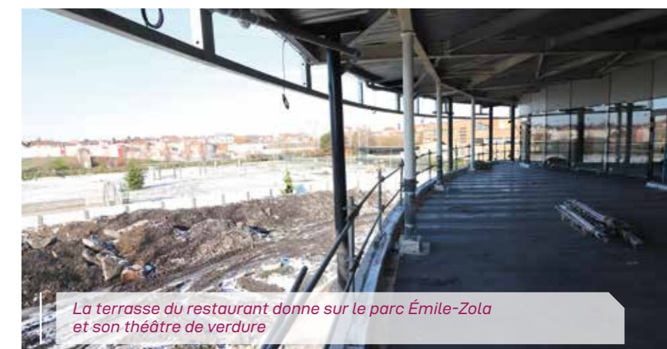
La terrasse du restaurant donne sur le parc Émile-Zola et son théâtre de verdure