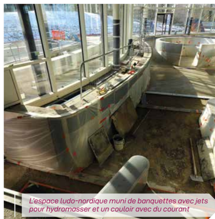
L'espace ludo-nordique muni de banquettes avec jets pour hydromasser et un couloir avec du courant

Vu de l'extérieur à travers les 1772 m 2 de baies vitrées plus communément appelées murs-rideaux, les différents niveaux offrent déjà une belle perspective avec les terrasses, les jardins puis au deuxième étage, l'espace bien-être avec un bain froid et un bain à remous bouillonnant. Le hammam et le sauna sont quasiment prêts à l'emploi. Et l'immense terrasse exposée sud-ouest va enchanter les aficionados du far niente. Toujours au second étage, le restaurant sera accessible au public par quatre entrées, deux de l'extérieur et deux de l'intérieur. L'hiver, il pourra servir 86 couverts contre 206 l'été grâce à sa terrasse donnant sur le parc Zola et son théâtre de verdure.