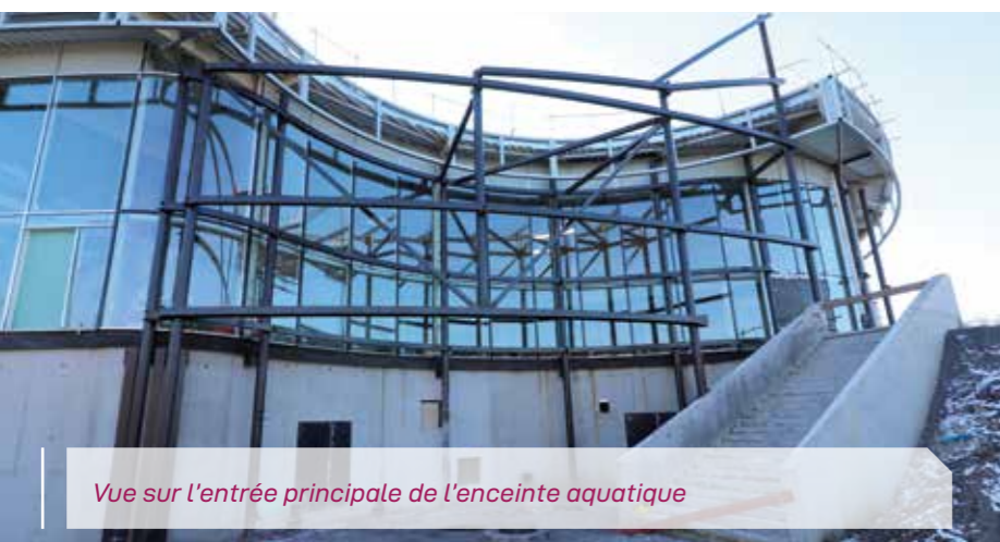
Vue sur l'entrée principale de l'enceinte aquatique

Avec le cinéma, le centre aquatique est l'autre grand projet en cours de réalisation. Au parc Emile-Zola, les usagers bénéficieront bientôt d'un équipement tout confort.