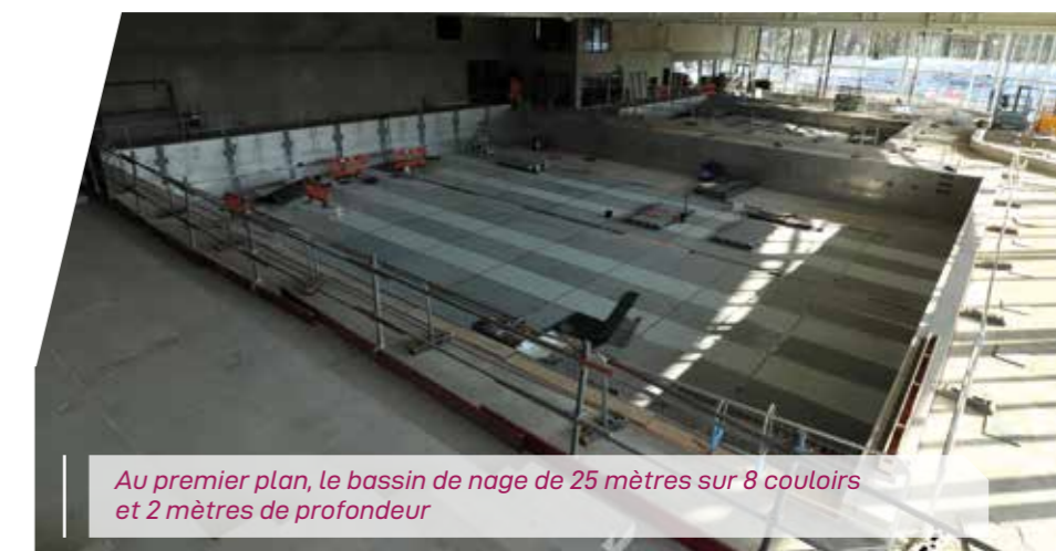
Au premier plan, le bassin de nage de 25 mètres sur 8 couloirs et 2 mètres de profondeur