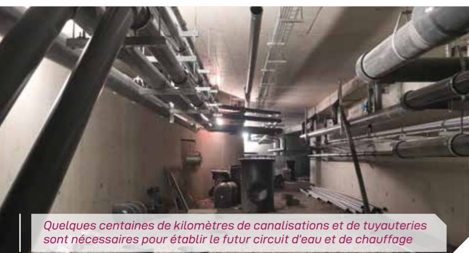
Quelques centaines de kilomètres de canalisations et de tuyauteries sont nécessaires pour établir le futur circuit d'eau et de chauffage