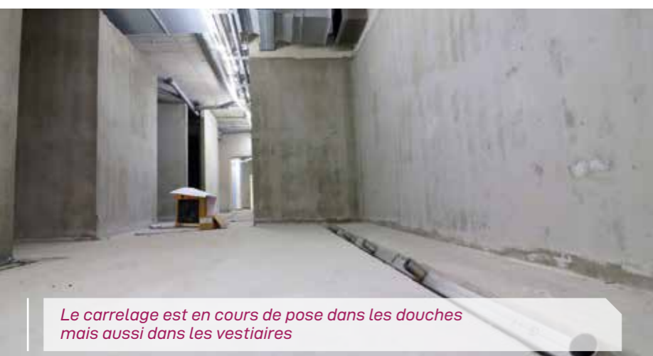
Le carrelage est en cours de pose dans les douches mais aussi dans les vestiaires