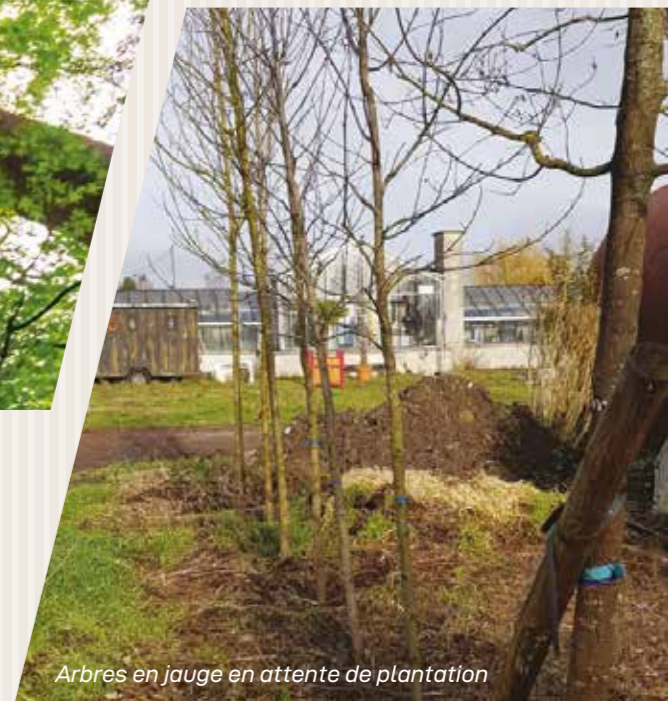
Arbres en jauge en attente de plantation