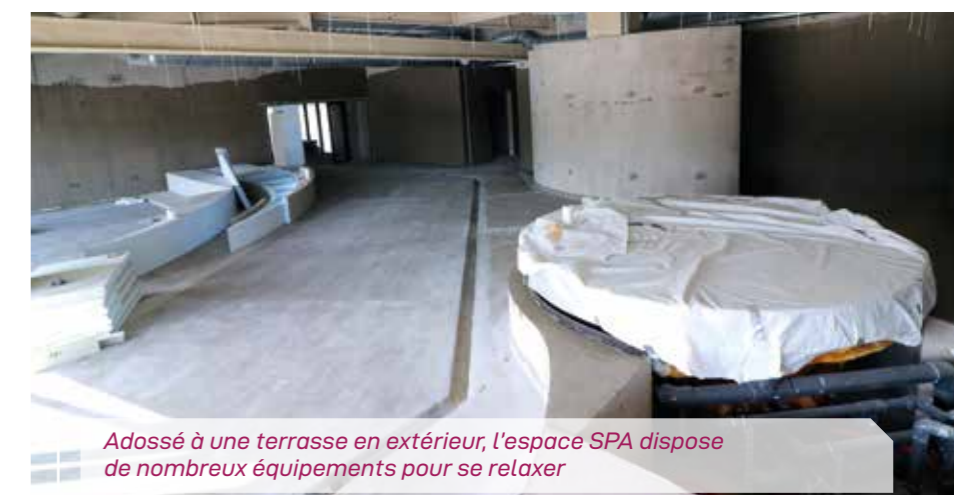
Adossé à une terrasse en extérieur, l'espace SPA dispose de nombreux équipements pour se relaxer

Vu de l'extérieur à travers les 1772 m 2 de baies vitrées plus communément appelées murs-rideaux, les différents niveaux offrent déjà une belle perspective avec les terrasses, les jardins puis au deuxième étage, l'espace bien-être avec un bain froid et un bain à remous bouillonnant. Le hammam et le sauna sont quasiment prêts à l'emploi. Et l'immense terrasse exposée sud-ouest va enchanter les aficionados du far niente. Toujours au second étage, le restaurant sera accessible au public par quatre entrées, deux de l'extérieur et deux de l'intérieur. L'hiver, il pourra servir 86 couverts contre 206 l'été grâce à sa terrasse donnant sur le parc Zola et son théâtre de verdure.