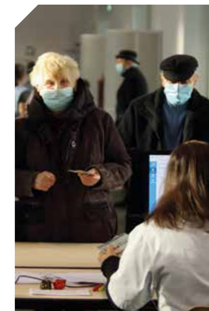
Habitants de Denain et ses environs, se présentant au centre de Vaccination

Le centre de vaccination est ouvert du lundi au samedi de 9 h à 17 h. Il est réservé, dans un premier temps, aux personnes de 75 ans et plus, aux professionnels de santé et aux personnes vulnérables sur attestation médicale. L'ouverture à d'autres publics se fera ensuite en fonction du calendrier gouvernemental. Pour un rendez-vous, connectez-vous sur Doctolib ou téléphonez au 06 71 28 71 54. Aucun frais n'est à avancer, la vaccination (non obligatoire) est intégralement prise en charge par l'Assurance Maladie. Face à la forte demande, la Ville invite les personnes à vérifier régulièrement la disponibilité de nouveaux rendez-vous. Ceux-ci sont conditionnés à l'approvisionnement en vaccins par l'État.