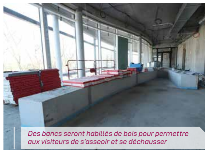
Des bancs seront habillés de bois pour permettre aux visiteurs de s'asseoir et se déchausser

Malgré la Covid et le protocole sanitaire, le chantier du centre aquatique suit son cours à un bon rythme. La longue et délicate phase consacrée à la pose de la charpente métallique et à son isolation phonique et thermique est achevée. Les ouvriers s'affairent à l'intérieur de l'enceinte et procèdent actuellement à l'installation des bassins. Même pour un néophyte de la natation, on devine aisément l'usage réservé aux trois bassins : le plus grand, d'une superficie de 525 m 2 sera consacré à la nage-loisir et accueillera les futures compétitions de natation et de water-polo. Les deux autres bassins seront dédiés à l'apprentissage et à la nage ludo-nordique. Se reconnaissant à sa forme incurvée, l'espace ludo-nordique disposera de 200 m 2 à l'intérieur et 100 m 2 à l'extérieur. « Dans l'eau, il y aura des banquettes massantes et une rivière de nage à courant » précise Alexandre Roch, conducteur des travaux. Juste derrière, il faut imaginer un toboggan et le départ du pentaglisser à trois pistes.