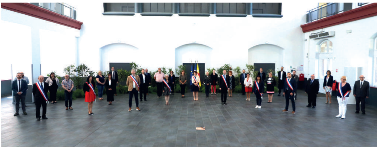
Cérémonie inédite pour l'installation, qui s'est tenue à huis clos et a été retransmise, le 28 mai à la salle des fêtes.