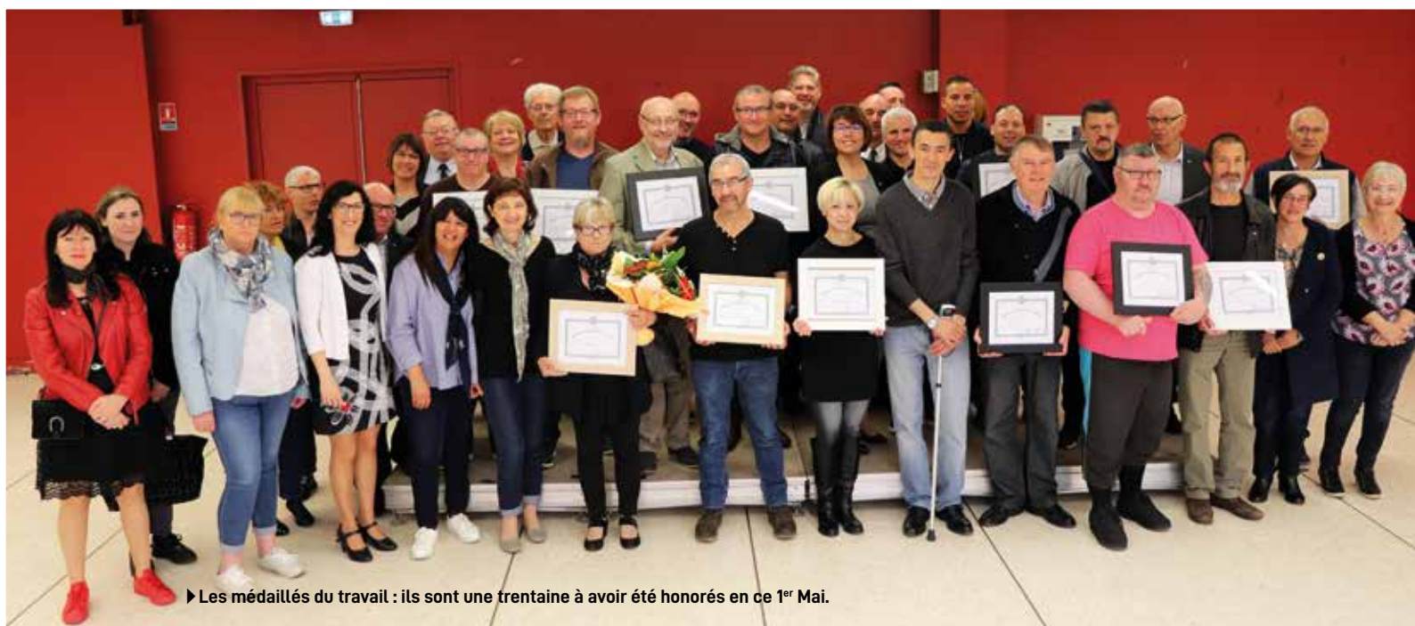
► Les médaillés du travail : ils sont une trentaine à avoir été honorés en ce 1 er Mai.