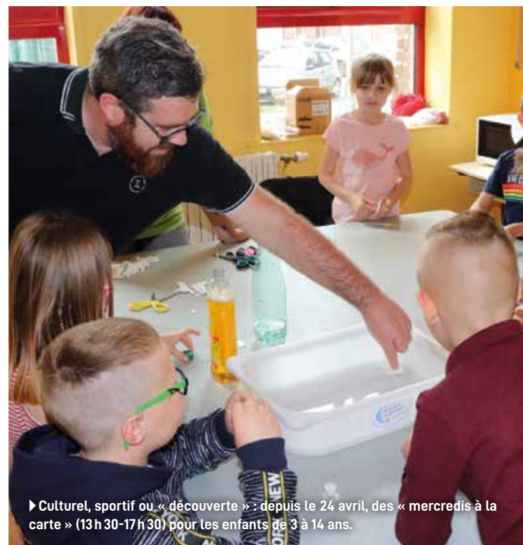
► Culturel, sportif ou « découverte » : depuis le 24 avril, des « mercredis à la carte » (13h30-17h30) pour les enfants de 3 à 14 ans.