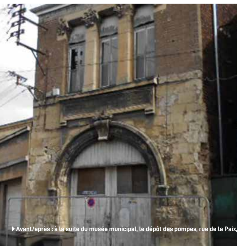
► Avant/après : à la suite du musée municipal, le dépôt des pompes, rue de la Paix, a bénéficié d'une rénovation extérieure. Quelle différence !