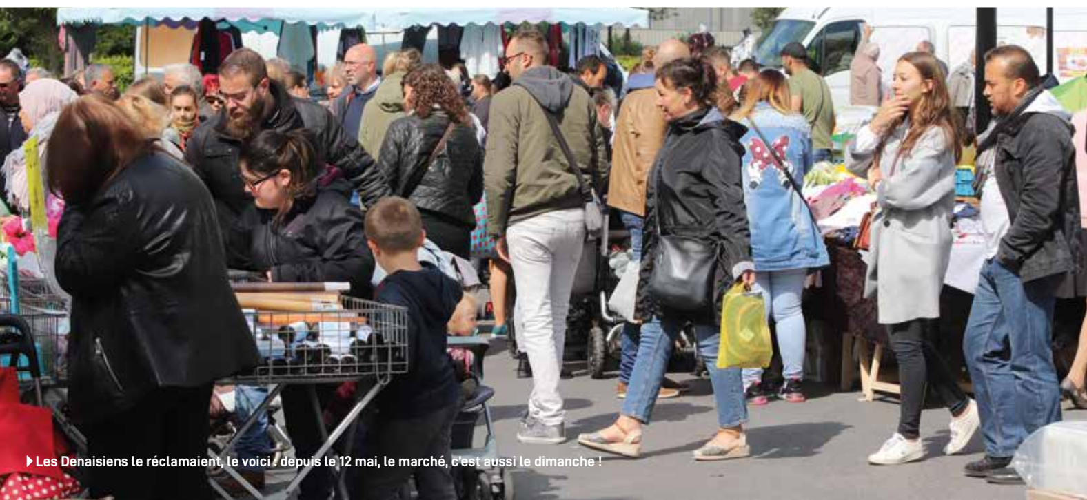
► Les Denaisiens le réclamaient, le voici : depuis le 12 mai, le marché, c'est aussi le dimanche !