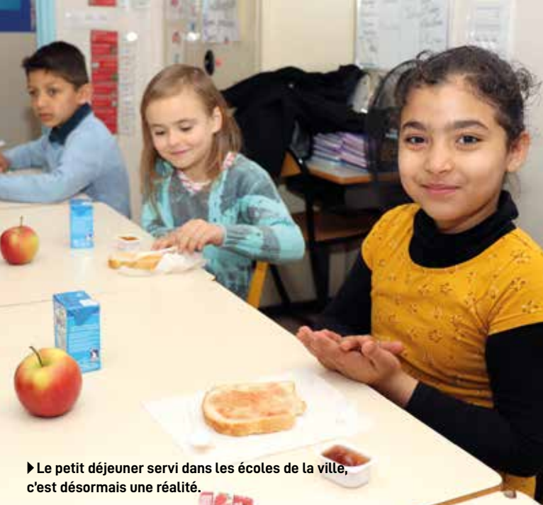
► Le petit déjeuner servi dans les écoles de la ville, c'est désormais une réalité.