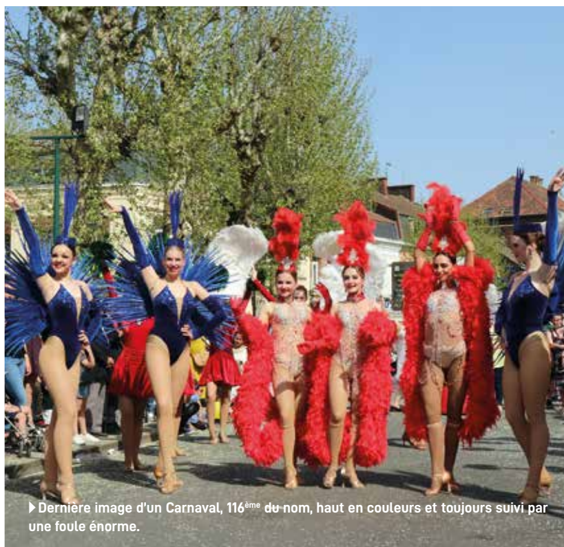
► Dernière image d'un Carnaval, 116 ème du nom, haut en couleurs et toujours suivi par une foule énorme.